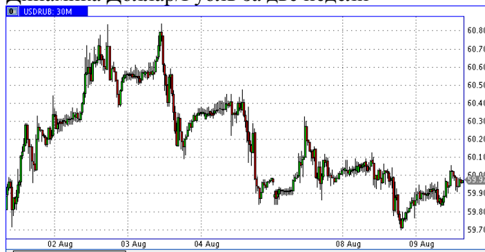
Динамика Доллар/Рубль за две недели

Продолжаем следить за ситуацией на нефтяном рынке. Сегодня в 17:30 будет опубликована статистика Минэнерго США по запасам нефти и нефтепродуктов, а в четверг и пятницу - ежемесячные отчёты ОПЕК и Международного энергетического агентства о состоянии нефтяного рынка. Трейдеры будут следить за прогнозами этих организаций по спросу/предложению “чёрного золота”. Вполне возможна повышенная волатильность нефти, а значит и курса рубля