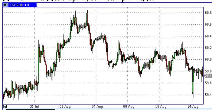
Динамика Доллар/Рубль за три недели

Рубль С оглядкой на стабильную нефть, курс рубля также сбалансировался в районе круглых отметок. По отношению к доллару – чуть ниже 60, у евро – чуть выше 70. Мы отмечаем стабильный спрос на российскую валюту со стороны инвесторов carry trade. Благодаря этому рубль смотрится уверенно в сравнении с другими валютами развивающихся стран. Спрос на рубль со стороны инвесторов carry trade в последнее время стабилизировался. Изменить баланс сил может заседание Центробанка РФ 15 сентября, но регулятор вряд ли будет спешить с активными действиями.