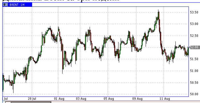
Динамика Brent за три недели

Нефть В последние дни Brent стабилизировались в районе $52. Устав от болтанки последних месяцев, они фактически игнорируют новостной фон. К примеру, на ход торгов на нефтяном рынке практически не оказали влияния обострение отношений между США и Северной Кореей, снижение прогноза мирового потребления нефти от МЭА и слабая статистика по Китаю. Последние два фактора – явный негатив для “чёрного золота”, но видимо нефтрейдеры смотрят в сторону повышения котировок. Поводом к росту могут стать данные по запасам в США в среду или заседание технического комитета ОПЕК 21 августа.