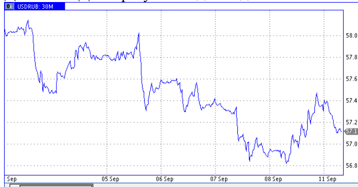
Динамика Доллар/Рубль за две недели

Рубль На прошлой неделе курс доллар/рубль опустился ниже отметки 57 – впервые с июня. В пользу рубля играли ослабление доллара, рост нефтяных котировок и спрос на российские облигации. Индекс Russian Government Bond Index поднялся до пятилетних максимумов на ожиданиях более быстрого снижения ставки – к этому подталкивает замедление инфляции. В частности, на заседании Центробанка РФ 15 сентября ожидается снижение ставки либо на 0,25%, либо на 0,5%.