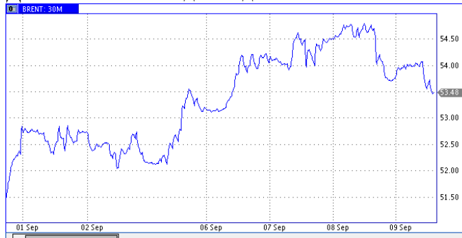
Динамика Brent за две недели

Нефть Прошлая неделя на мировых рынках прошла под знаком роста нефтяных котировок. Это происходило на фоне ослабления доллара, снижение экспорта нефти странами ОПЕК в августе, опасения новых ураганов в Мексиканском заливе и снижение добычи нефти в США на 750 тысяч баррелей за неделю согласно данным Минэнерго. Тем временем, в Атлантическом океане возникло ещё три урагана (Ирма, Хосе и Катя), которые могут угрожать нефтяной инфраструктуре Мексиканского залива. Ураган Ирма уже приближается. Если он будет иметь такие же масштабные последствия, как и Харви, то $55 за баррель не станут барьером для Brent. 20% НПЗ США, сосредоточенные в Техасе и Луизиане, по-прежнему закрыты.