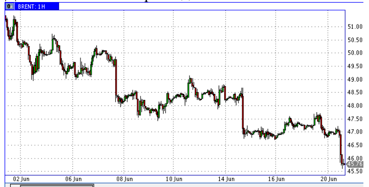
Динамика Brent за три недели

Дальнейшая динамика будет зависеть от того, будут ли введены новые санкции к России. Если нет – рубль отыграет потери. Если да – то доходность российских облигаций в глазах carry traders может не перекрыть политические риски. В этом случае, постепенный исход инвесторов из российских облигаций может продолжиться, а доллар-рубль может подняться в район 60. Сейчас никакой паники на рынках не наблюдается, причин для сильного ослабления рубля нет.