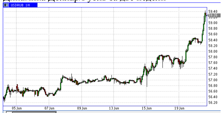
Динамика Доллар/Рубль за две недели