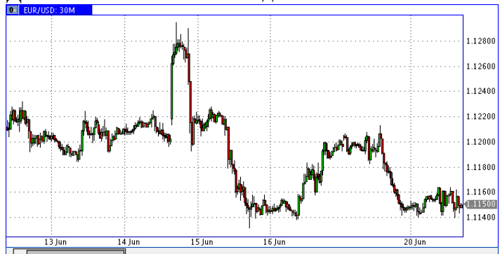
Динамика EUR/USD за неделю