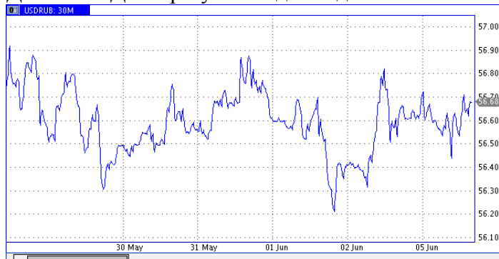
Динамика Доллар/Рубль за две недели