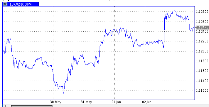
Динамика EUR/USD за неделю