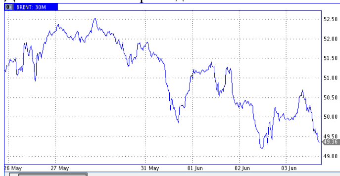
Динамика Brent за три недели

Рубль Рубль долгое время сопротивлялся негативу со стороны нефтяных цен и выглядел лучше своих “сырьевых коллег” (канадского доллара, бразильского реала, норвежской кроны). Но в конце прошлой недели всё же пошатнулся. USD/RUB полнялся к 56,6, а EUR/RUB к 63,8. Отметим, что российские облигации продолжают пользоваться популярностью. Общий отток средств фондов из России затронул лишь фондовый рынок, но не сегмент облигаций. Ставки в российской экономике продолжают держаться на высоком уровне, привлекая инвесторов carry trade. Снижение ставки на 0,25% на ближайшем заседании Центробанка РФ 16 июня назрело. Судя по оптимистичным комментариям Эльвиры Набиуллиной на ПМЭФ, понимают это и в ЦБ РФ. На этой неделе USD/RUB будет торговаться в диапазоне 56-57, а EUR/RUB 63-64,4